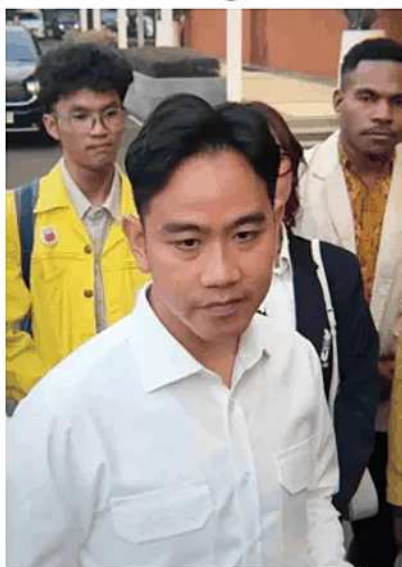
Wakil Presiden RI Gibran Rakabuming Raka kembali melaksanakan kunjungan kerja ke sejumlah wilayah di Indonesia Timur.