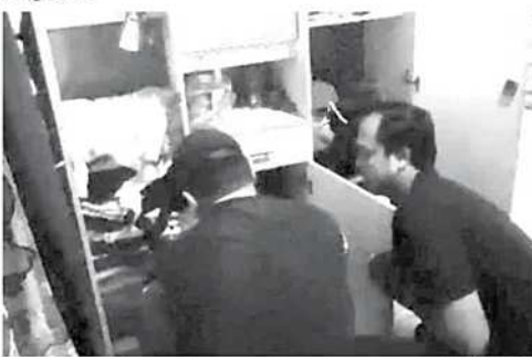
Petugas gabungan Unit Reskrim Polsek Kopo dan Tim Resmob melakukan penggeledahan di rumah pelaku pencurian.

"Berdasarkan informasi yang kami peroleh serta