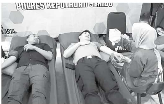
DONOR – Polres Kepulauan Seribu menggelar kegiatan donor darah yang melibatkan berbagai elemen masyarakat sebagai wujud kebersamaan dan kepedulian sosial, Kamis (18/5/2026).

Melalui peringatan Hari Bhayangkara ke-80, Polres Kepulauan Seribu berkomitmen untuk terus hadir di tengah masyarakat, tidak hanya dalam menjaga keamanan dan ketertarikan, tetapi juga melalui berbagai kegiatan kemanusiaan yang memberikan manfaat langsung bagi warga. (pan)