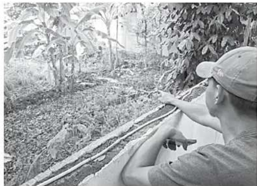
LIIMBAH - Ketua RT bersama warga menunjukan lokasi aliran limbah sisa tinja manusia mengeluarkan bau tidak sedap yang mengganggu pernapasan.

lokasi, lahan kosong yang diduga menjadi titik pembuangan limbah berada di