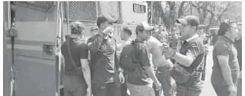
PENGAMANAN: Petugas kepolisian mengamankan sejumlah orang yang diduga menghalangi proses eksekusi Barung Milik Negeri (BMN) Blok 15 di kawasan eks Hotel Sultan, Kompleks Gelora Bung Karno (GBK), Senayan, Jakarta Pusat, Kamis (18/6). Sebanyak 119 orang dibawa ke Polda Metro Jaya untuk menjalani pemeriksaan setelah bentrokan yang menyebabkan 31 orang terluka.

"Kami mengajak seluruh masyarakat untuk tetap berpikir jernih dan menghormati proses hukum yang sedang berjalan, sehingga situasi keamanan dan ketertiban masyarakat tetap terjaga," kata Budi. (man)