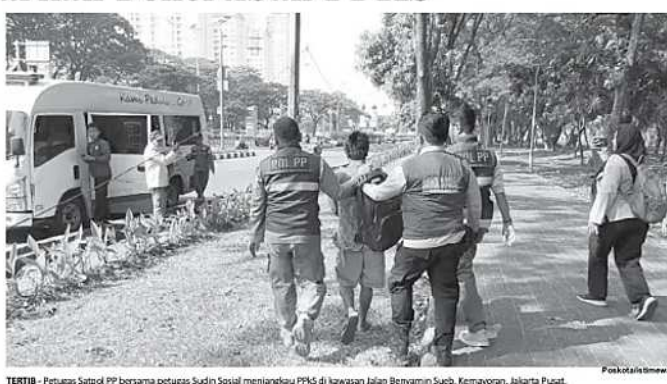
TERTIB – Petugas Satpol PP bersama petugas Suku Dinas Sosial menjangkau PPKS di kawasan Jalan Benyamin Sueb, Kemayoran, Jakarta Pusat.

Operasi Tertib Bina Praja tersebut melibatkan unsur TNI, Polri, Suku Dinas Perhubungan, Suku Dinas Sosial, serta Forum Kewaspadaan Dini Masyarakat (FKDM). "Kegiatan ini merupakan kerja bersama lintas instansi demi memberikan rasa aman dan nyaman bagi warga Kemayoran," tutup Bronson. (den)