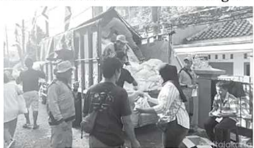
BANTUAN – Warga penerima manfaat di Kelurahan Palmeriam, Kecamatan Matraman, Jakarta Timur, ante bantuan pangan.