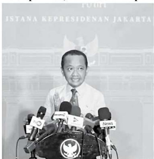
Menteri Energi dan Sumber Daya Mineral (ESDM) Bahlil Lahadalia.

JAKARTA (Poskota) - Menteri Energi dan Sumber Daya Mineral (ESDM) Bahlil Lahadalia mengungkapkan sejumlah poin penting yang dibahas dalam rapat bersama Menteri Koordinator Bidang Perekonomian Airlangga Hartarto, Kamis (18/6).