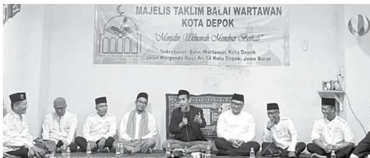
MENGAJI - Wartawan Kota Depok menggelar Majelis Taklim rutin yang digelar di Balai Wartawan Gedung Baleka, Pemkot Depok, Kamis (18/6/2026).

"Jadwal pembagian rapor setiap sekolah berbeda-beda, namun informasi terakhir berkisar antara 24 sampai 26 Juni," tuturnya. (den)