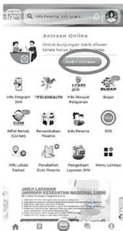
Fitur Antrean Online di Aplikasi Mobile JKN.

Melalui Mobile JKN, peserta dapat mencari lokasi fasilitas kesehatan terdekat,