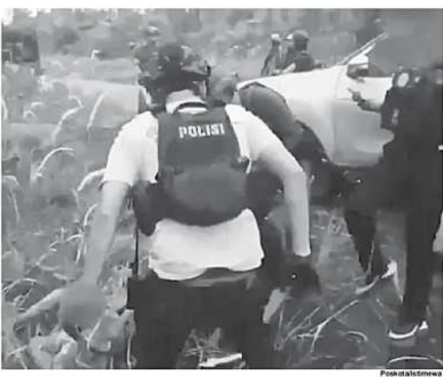
Satgas Damai Cartenz menembak mati Komandan KK Batalyon Muara Kali HSSBI, AP, setelah pengejaran, markas KKB.

Melalui penguatan sinergi tersebut, kedua lembaga berharap upaya pencegahan dan pemberantasan korupsi, khususnya yang melibatkan sektor jasa keuangan, dapat dilakukan secara lebih efektif dan terintegrasi. (tog)