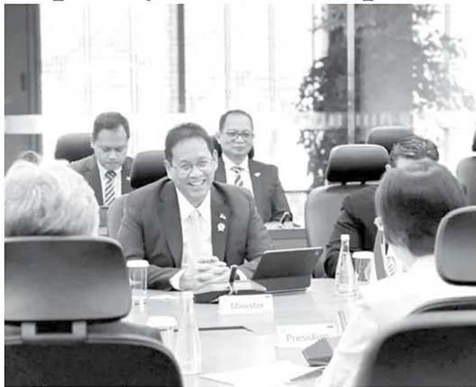
Menteri Keuangan Purbaya Yudhi Sadewa.