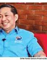
Ketua Umum Partai Gelora, Anis Matta.

Ia menegaskan, keber-lanjutan kepemimpinan bu-