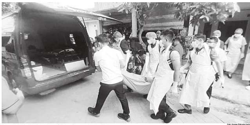
Petugas Inafis Satreskrim Polresta Serang Kota tengah mengevaluasi jasad korban.

Polisi memastikan proses penyelidikan akan terus dilakukan secara profesional untuk mengungkap seluruh fakta di balik kasus pembunuhan tersebut. (vtr)