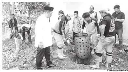
BIOPORI - Sebanyak 1.000 lubang biopori jumbo bakal dibuat di wilayah Kecamatan Cipayung, Jakarta Timur.

Menurutnya, program tersebut tidak hanya difokuskan di lingkungan pondok pesantren. Sejumlah lokasi lain juga akan menjadi sasaran pembangunan biopori jumbo,