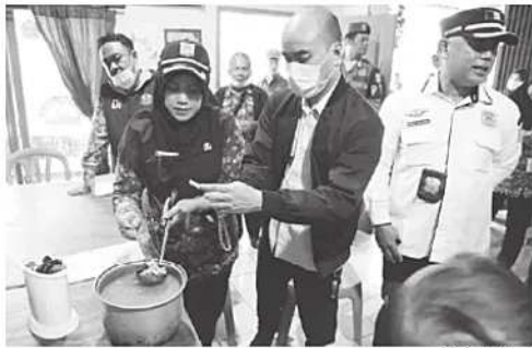
SANKSI - Petugas gabungan memberikan surat peringatan kepada pemilik sebuah rumah makan di Jalan Pangrango, Kelurahan Cengkareng Timur, jual daging anjing, Rabu (17/6/2026).