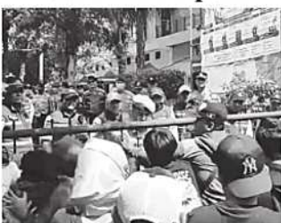
UNJUK RASA - Ratusan warga Kebon Sayur menggelar aksi unjuk rasa di depan Kantor Kelurahan Kapuk, Kecamatan Cengkareng, Jakarta Barat, Rabu (17/6/2026).

Menurutnya, pemerintah harus berpedoman pada regulasi yang berlaku, di antaranya