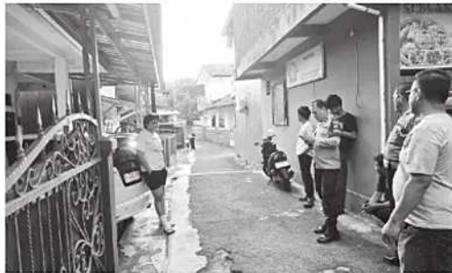
CURANMOR - Anggota Polsek Cimanggis melakukan cek TKP pencurian dua unit motor sekaligus di daerah Tugu, Kecamatan Cimanggis, Kota Depok.