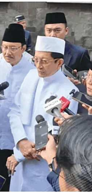
Menteri Agama RI Prof. KH. Nasaruddin Umar bersama Sekretaris Jenderal PBNU Saifulah Yusuf atau Gus Ipol dalam suatu acara beberapa waktu lalu.

bagi figur yang paling sering disebut sebagai calon potensial.