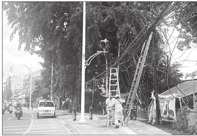
KABEL UTILITAS SEMRAWUT. Suku Dinas Bina Marga Jakarta Selatan mulai merapikan kabel semrawut di Jalan Prof DR Soepomo, Kelurahan Tebet Barat, Kecamatan Tebet. Pemandangan kabel utilitas yang semrawut hingga menumpuk di atap rumah warga tak jarang ditemui di Jakarta. Namun, kabel yang menjuntai dan melintang tak beraturan ternyata bukan sekadar menimbulkan masalah estetika kota, tapi juga keselamatan warga.

"Kurangi omong-omong, kurangi kunjungan ke luar negeri."