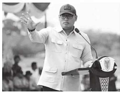
Wakil Menteri Pertanian (Wamentan) Sudaryono.

Selain melalui APBN, pemerintah juga mendorong