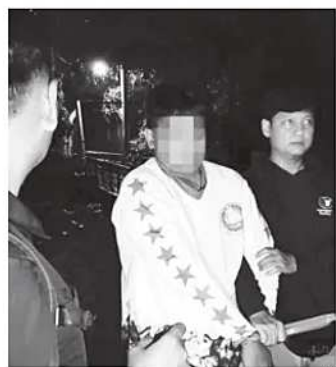
Pelaku saat diamankan oleh petugas kepolisian.

Melalui berbagai program preventif tersebut, Pemerintah Kota Tangerang berharap angka stunting dapat terus ditekan sekaligus meningkatkan kualitas kesehatan generasi masa depan. (tog)