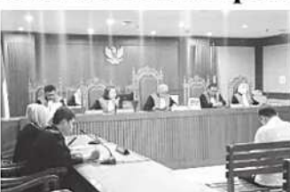
Pewakilan terdakwa korporasi PT Aset Indonesia dalam sidang pembacaan putusan majelis hakim di Pengadilan Tipikor pada PN Jakpus.

"Menjatuhkan pidana denda terhadap terdakwa PT Aset Indonesia Tbk sebesar Rp350 juta," kata Hakim Lucy saat membacakan putusan di Pengadilan Tindak Pidana Korupsi (Tipikor) Jakarta, Rabu (17/6).