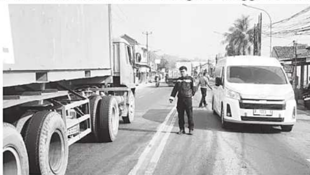
Petugas Unit Gakkum Satlantas Polresta Serang Kota tengah melakukan olah TKP di lokasi kejadian.

"Korban mengalami luka berat dan dinyatakan meninggal dunia di Instalasi Gawat Darurat berdasarkan