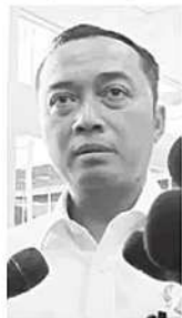
Menteri Sekretaris Negara Prasetyo Hadi.

JAKARTA (Poskota) - Presiden Republik Indonesia, Prabowo Subianto, memutuskan tidak menghadiri Konferensi Tingkat Tinggi (KTT) Rusia-ASEAN. Keputusan tersebut diambil karena Presiden memilih memprioritaskan sejumlah agenda strategis di dalam negeri yang masih perlu mendapat perhatian langsung.