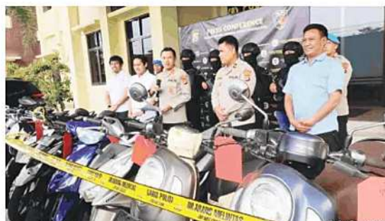
PENCURIAN: Beretan 16 unit sepeda motor hasil curanmor yang berhasil diamankan Polres Pandeglang dalam pengungkapan enam kasus pencurian kendaraan bermotor selama periode Maret hingga Juni 2026.