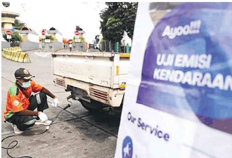
UJI EMISI: Petugas melakukan uji emisi pada kendaraan di Jakarta. Memasuki puncak musim kemarau, Pemprov DKI Jakarta memperkuat pelaksanaan uji emisi sebagai salah satu langkah menekan pencemaran udara yang kembali memburuk akibat minimnya curah hujan, lemahnya kecepatan angin, serta meningkatnya emisi dari sektor transportasi. Uji emisi menjadi instrumen penting untuk mengurangi kontribusi kendaraan bermotor terhadap polusi udara di Ibu Kota.